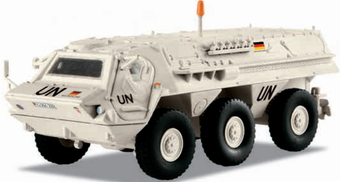
Bundeswehr: Transportpanzer „Fuchs“ – Modellgröße 1:87

Vorbild: Transportpanzer 1 (TPz1) «Fuchs» der Deutschen Bundeswehr des Einsatzes UNOSOM II 1993/94. Radfahrzeug mit Allradantrieb (6 x 6), schwimmfähig. Auslandsversion in weißer Farbgebung mit Aufschriften des UNSOM II-Einsatzes der Bundeswehr 1993/94.