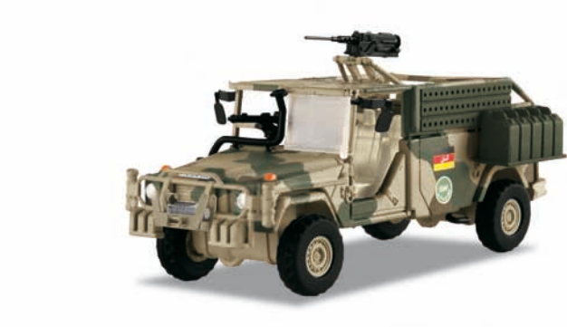
Bundeswehr: Aufklärungs- und Gefechtsfahrzeug (AGF) „Serval“ – Modellgröße 1:87

Vorbild: Leichtes Infanterie-Fahrzeug (LIV) «Serval», der Deutschen Bundeswehr der ISAF Schutztruppen in Afghanistan. Aufgerüstete Sonderausführung des Geländewagens «Wolf» für das Kommando Spezialkräfte (KSK) mit Allradantrieb und Bewaffnung. Auslandsversion in Umtarnfarben.