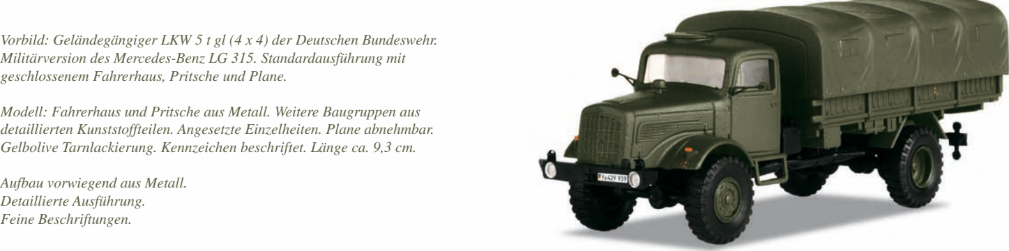
Bundeswehr: Lastwagen „5-Tonner“ mit Pritsche – Modellgröße 1:87

Vorbild: Geländegängiger LKW 5 t gl (4 x 4) der Deutschen Bundeswehr. Militärversion des Mercedes-Benz LG 315. Standardausführung mit geschlossenem Fahrerhaus, Pritsche und Plane.