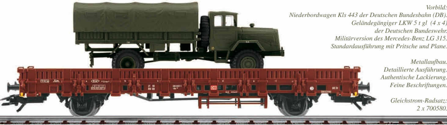
Bundeswehr: Bahntransport mit 1 Mercedes-Benz LG 315 „Pritsche“ – Modellgröße 1:87 Modell: Transportwagen mit Bordwänden in Pressblech-Struktur. Länge über Puffer 15,7 cm. Militärfahrzeug mit Fahrerhaus und Pritsche aus Metall. Weitere Baugruppen aus detaillierten Kunststoffteilen. Angesetzte Einzelheiten. Plane abnehmbar. Tarnlackierung oliv. Kennzeichen beschriftet. Länge ca. 9,3 cm.

Vorbild: Niederbordwagen Kls 443 der Deutschen Bundesbahn (DB). Geländegängiger LKW 5 t gl (4 x 4) der Deutschen Bundeswehr. Militärversion des Mercedes-Benz LG 315. Standardausführung mit Pritsche und Plane.