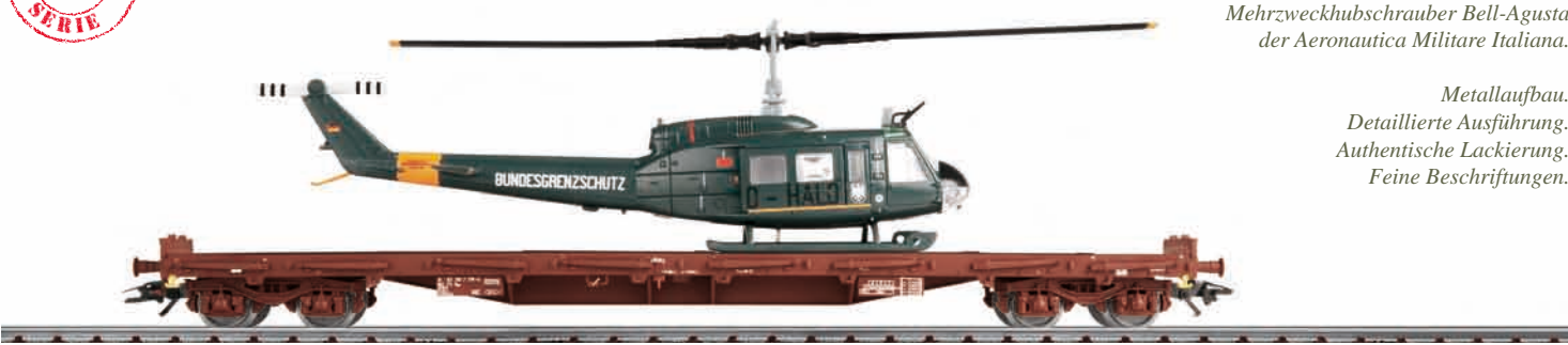
Italienische Armee: Hubschrauber-Transport – Modellgröße 1:87

Modell: Transportwagen mit beweglichen Rungen. Länge über Puffer 22,9 cm. Hubschraubermodell mit Metallrumpf und weiteren Baugruppen aus