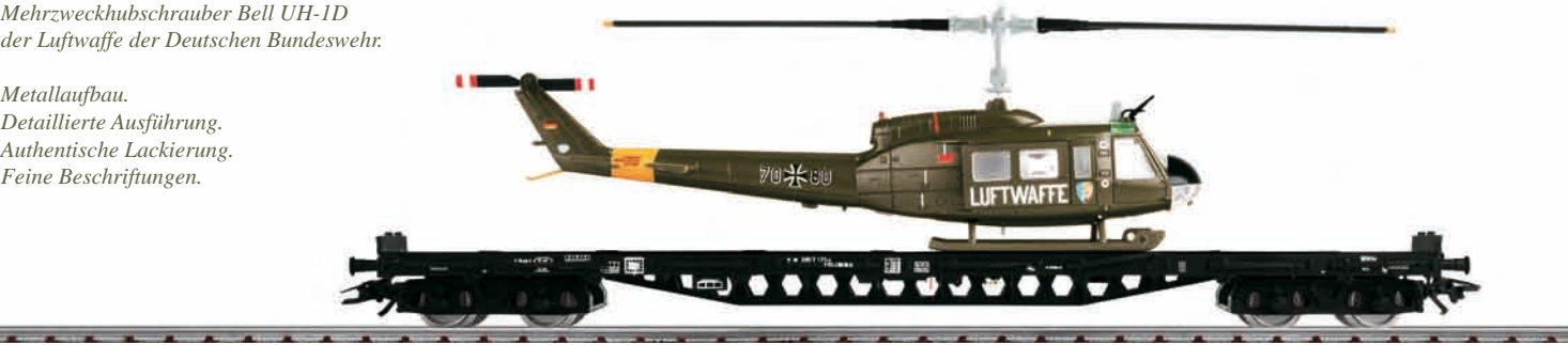
Bundesluftwaffe: Rs 648 DB + Bell UH-1D – Modellgröße 1:87

Metallaufbau. Detaillierte Ausführung. Authentische Lackierung. Feine Beschriftungen.