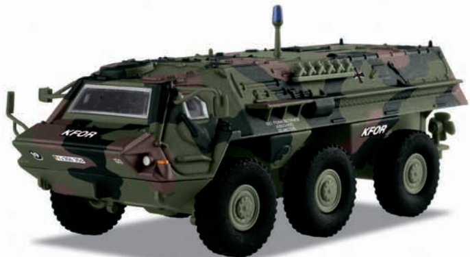
Bundeswehr: Transportpanzer „Fuchs“ – Modellgröße 1:87

Vorbild: Transportpanzer 1 (TPz1) «Fuchs» der Deutschen Bundeswehr der KFOR-Schutztruppe im Kosovo. Radfahrzeug mit Allradantrieb (6 x 6), schwimmfähig. Auslandsversion in dreifarbiger Flecklackierung mit KFOR-Kennzeichnung.