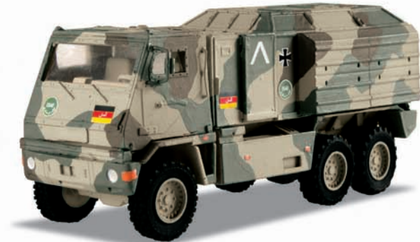
Gepanzertes Einsatzfahrzeug „Yak“ – Modellgröße 1:87