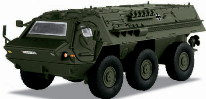
Bundeswehr: Transportpanzer „Fuchs“ – Modellgröße 1:87

Vorbild: Transportpanzer 1 (TPz1) «Fuchs» der Deutschen Bundeswehr. Radfahrzeug mit Allradantrieb (6 x 6), schwimmfähig.