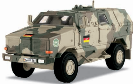
ATF 2 „Dingo“ – Modellgröße 1:87

Vorbild: Allschutz-Transport-Fahrzeug (ATF) «Dingo» der Deutschen Bundeswehr für die ISAF-Schutztruppen in Afghanistan. Mit gepanzertem Innenraum aufgebaut auf einem geländegängigen Standard-Fahrgestell. Auslandsversion in Umtarnfarben.