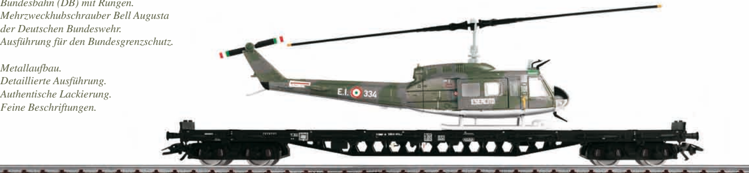
Bundesgrenzschutz: Hubschraubertransport – Modellgröße 1:87

Metallaufbau. Detaillierte Ausführung. Authentische Lackierung. Feine Beschriftungen.