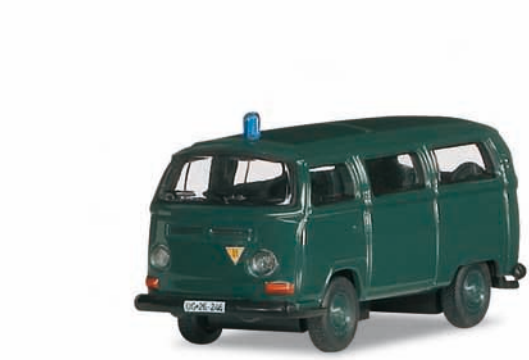
Bundesgrenzschutz: PKW 8 Sitze – Modellgröße 1:87

Vorbild: PKW 8 Sitze des Deutschen Bundesgrenzschutzes (heute Bundespolizei). Ausführung des VW Bus T2 für universellen Einsatz. In authentischer schwarzgrüner Ausführung.