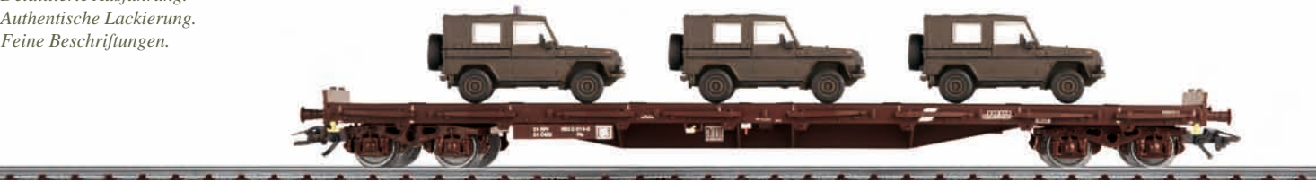
Bundesheer Österreichs: Puch G -Transport – Modellgröße 1:87

Metallaufbau. Detaillierte Ausführung. Authentische Lackierung. Feine Beschriftungen.