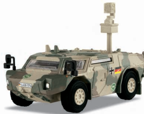
SpW „Fennek“ – Modellgröße 1:87

Vorbild: Spähwagen leicht 4-Rad (SpW) «Fennek» der Deutschen Bundeswehr der ISAF-Schutztruppen in Afghanistan. Einfach gepanzertes Radfahrzeug mit Aufklärungs-Ausrüstung. Auslandsversion in Umtarnfarben.