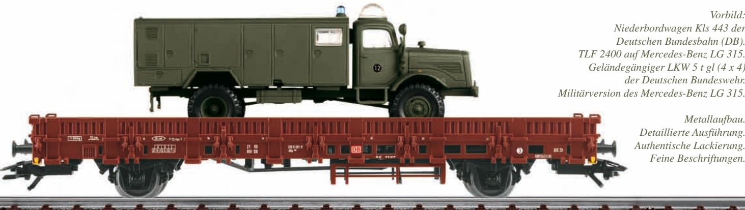
Bundeswehr: Bahntransport mit TLF 2400 auf Mercedes-Benz LG 315 – Modellgröße 1:87 Modell: Transportwagen mit Bordwänden in Pressblech-Struktur. Länge über Puffer 15,7 cm. Militärfahrzeug mit Fahrerhaus aus Metall. Weitere Baugruppen aus detaillierten Kunststoffteilen. Angesetzte Einzelheiten. Authentische Lackierung. Kennzeichen beschriftet. Länge ca. 9,3 cm.

Vorbild: Niederbordwagen Kls 443 der Deutschen Bundesbahn (DB). TLF 2400 auf Mercedes-Benz LG 315. Geländegängiger LKW 5 t gl (4 x 4) der Deutschen Bundeswehr. Militärversion des Mercedes-Benz LG 315.