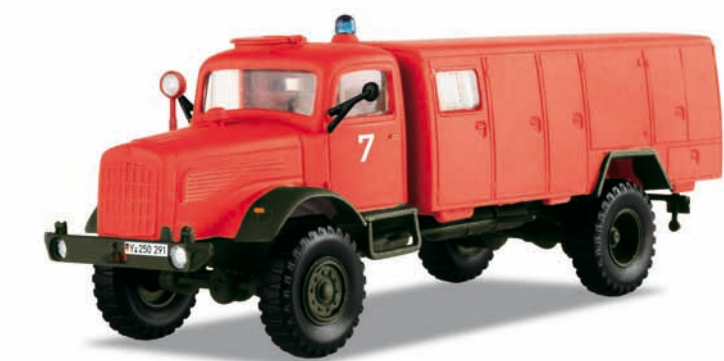
Bundeswehr: Flughafen-Feuerwehrfahrzeug TLF 2400 – Modellgröße 1:87

Vorbild: Flughafen-Feuerwehrfahrzeug, LKW 5 t gl (4 x 4), der Deutschen Bundeswehr. Feuerwehr-Version des Mercedes-Benz LG 315. Standardausführung mit geschlossenem Fahrerhaus.