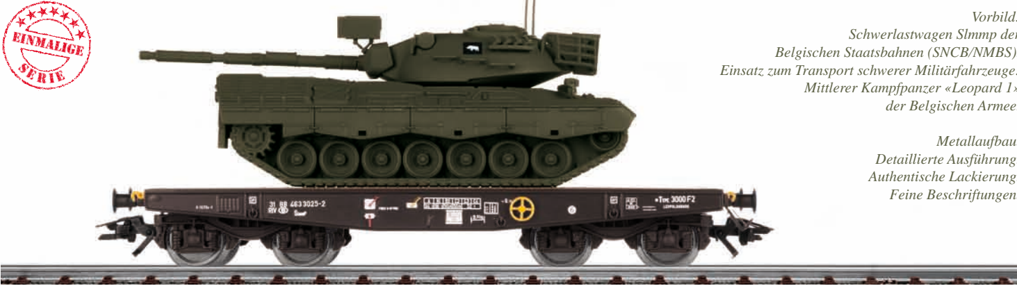
Belgische Armee: Panzertransport mit „Leopard1“ – Modellgröße 1:87 Modell: Flachwagen mit Metallrahmen. Länge über Puffer 12,4 cm. Militärfahrzeug mit Aufbau aus Metall. Weitere Baugruppen aus detaillierten Kunststoffteilen. Angesetzte Einzelheiten. Turm drehbar, Waffe beweglich Authentische Farbgebung. Kennzeichen beschriftet. Länge ca. 8,4 cm, mit Waffe ca. 11,0 cm. stofferleiten. Angesetzte Einzelheiten. Turm drehbar, Waffe beweglich Authentische Farbgebung. Kennzeichen beschriftet. Länge ca. 8,4 cm, mit Waffe ca. 11,0 cm.