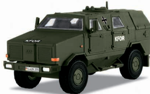
ATF 2 „Dingo“ – Modellgröße 1:87